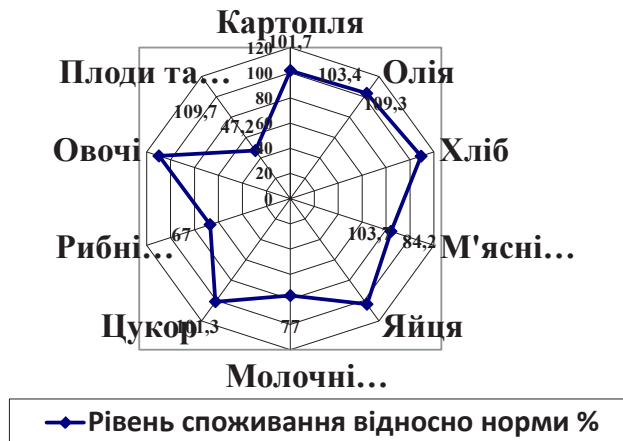
Рис. 1. Рівень забезпечення основних продуктів харчування населенням України відносно раціональної норми споживання

держави, є показник забезпечення раціональної норми споживання населенням України основних продуктів харчування (рис. 1).