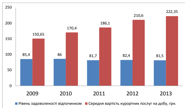
Рис. 1. Динаміка співвідношення показника «ціна-якість» в АР Крим

Результати аналізу показали, що у 2013 році респонденти в цілому позитивно оцінили відпочинок у Криму, більшість споживачів стверджують на формування задоволеності впливають багато факторів, у тому числі задоволеність якістю та ціною на рекреаційний продукт. Таким чином, на «відмінно» оцінили 52,6% гостей півострів, на «четвірку» – 20,1%, оцінку «задовільно» поставили 17,9% і 10,6% – «двійку». Проте найчастіше споживачі рекреаційних послуг незадоволені показником «ціна-якість», які не відповідають очікуванням. Незважаючи на збільшення ціни, якість рекреаційної послуги в динаміці показує зниження, тобто якість надання послуги залишається на низькому рівні (рис. 1).