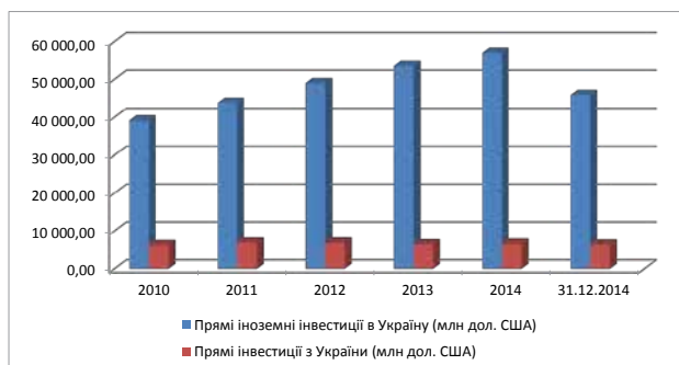
Рис. 2. Динаміка прямих іноземних інвестицій

Впродовж останніх кількох років можемо спостерігати покращення ситуації щодо залучення іноземних інвестицій в економіку нашої країни, проте обсяги залучених інвестицій наразі не відповідають тому рівню, який реально потрібен нашій економіці. За інформацією Держкомстату, на 31 грудня 2014 р. обсяг прямих іноземних інвестицій, внесених в економіку України з початку інвестування, становив 45 916,0 млн дол., що з розрахунку на душу населення становить 1,07 тис. дол. США (рис. 2).