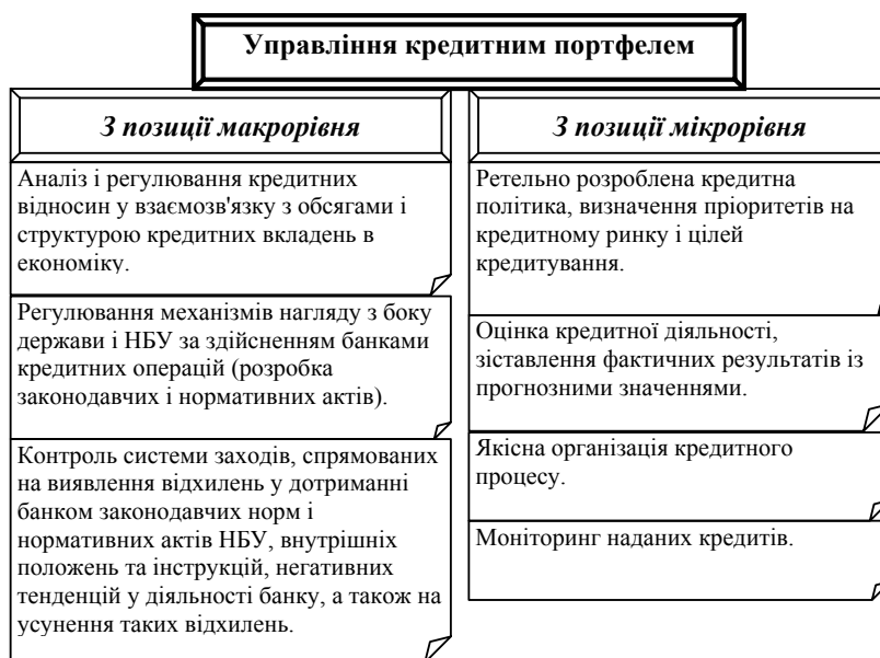
Рис. 2. Елементи управління кредитним портфелем

визначення категорії «кредитний портфель» пропонуємо під кредитним портфелем розуміти сукупність кредитів структурованих за терміном, валютою, ступенем ризику з метою