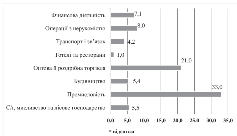
Рис. 2. Структура обсягу збитку підприємств за видами економічної діяльності у 2013 році [7]

Реалізація антикризової стратегії полягає у виборі і використанні діючих внутрішніх механізмів нейтралізації кризової ситуації на підприємстві – антикризових заходів. Сукупність антикризових заходів, спрямованих на управління будь-яким одним фактором, являє собою антикризову програму.