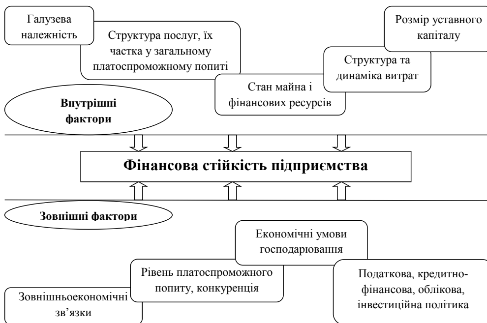
Рис. 2. Фактори впливу на фінансову стійкість підприємства [5; 11; 12]

Залежно від впливу означених вище факторів можна виділити такі види фінансової стійкості підприємства, як поточна (на момент проведення аналізу) та потенційна (перспектива нарощувати обсяги діяльності протягом певного часу, вихід на новий рівень фінансової рівноваги).