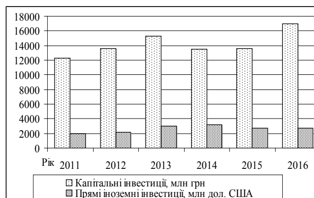
Рис. 3. Динаміка інвестицій у харчову промисловість України в 2011–2016 рр.