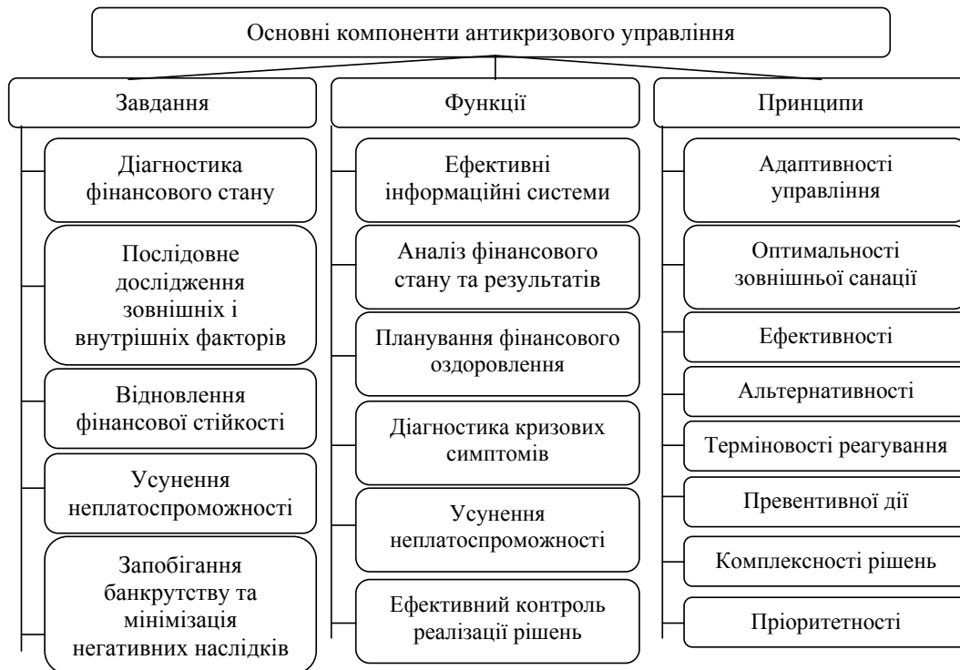
Рис. 3. Перелік основних компонентів антикризового фінансового управління [2].

в дію спеціальні фінансові механізми захисту або обґрунтувати необхідність певних реорганізаційних процедур.