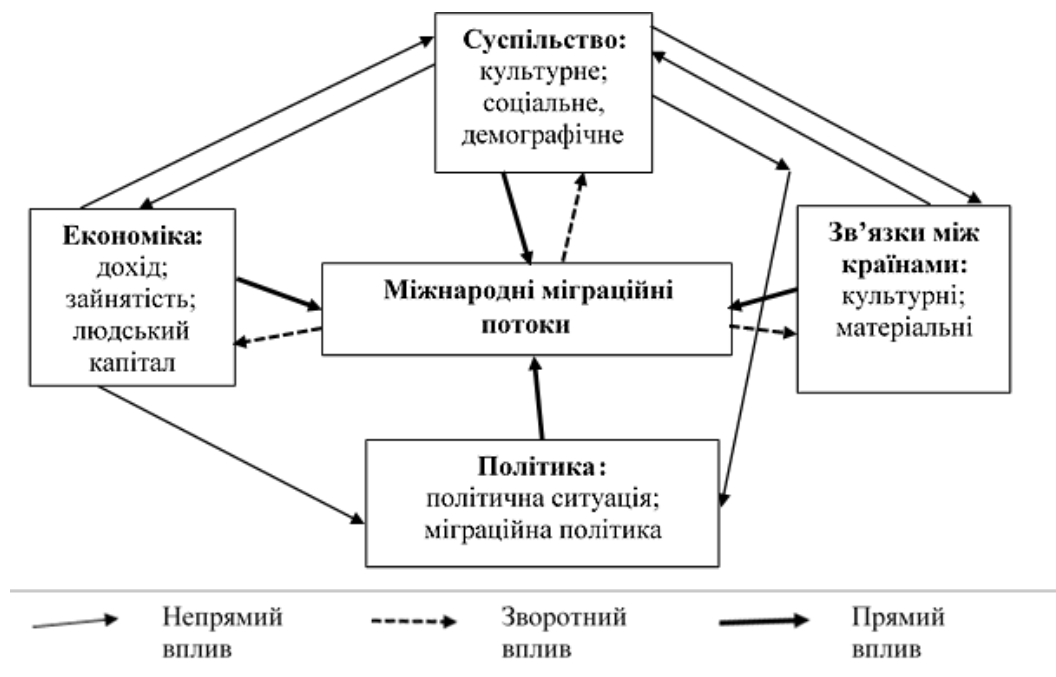
Рис. 3. Теоретична основа причинно-наслідкових зв'язків між міжнародною міграцією та її детермінантами в міграційній системі [18, с. 416]

набуває властивостей, що спричинені внутрішньосистемними взаємозв'язками. Таким чином, на думку І. Івахнюк, у міграційних системах міграція є й причиною, й результатом системної взаємодії країн [20]. Однак у своїх працях дослідниця керується чітким географічним підходом до виокремлення меж міграційних систем і концентрує увагу переважно на Євразійській міграційній системі, центром якої вона вважає Росію. Усе це, на нашу думку, є проявом домінування неоевразійської геополітичної доктрини Л. Гумільова у поглядах авторки.