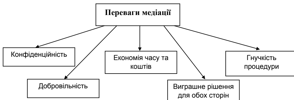
Рис. 1. Переваги медіації (авторське розуміння)

Гнучкість процедури. Медіація може бути перервана в будь-який час за ініціативи будь-кого з учасників медіації. Склад учасників (юристи, родичі, повноважні представники тощо) визначається самостійно кожною зі сторін. Сторони самі вирішують, за яких умов вони будуть укласти угоду чи припинити медіацію [5; 7].