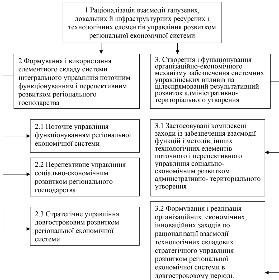
Рис. 2. Схема раціоналізації управлінських впливів системи інтегрального управління та організаційно-економічного механізму на галузеві, локальні, інфраструктурні ресурсні та технологічні елементи регіональної економічної системи

Розвиваючи теоретичні положення про механізм управління регіональною економічною системою як про інструментарій раціоналізації її елементної взаємодії, організаційна та економічна доцільність поділу процесу раціоналізації взаємодії елементів регіональної економічної системи на формування та використання інтегрального управління, що з'єднує поточне (річне), перспективне (2-5 років) і стратегічне управління, організаційно-економічного меха-