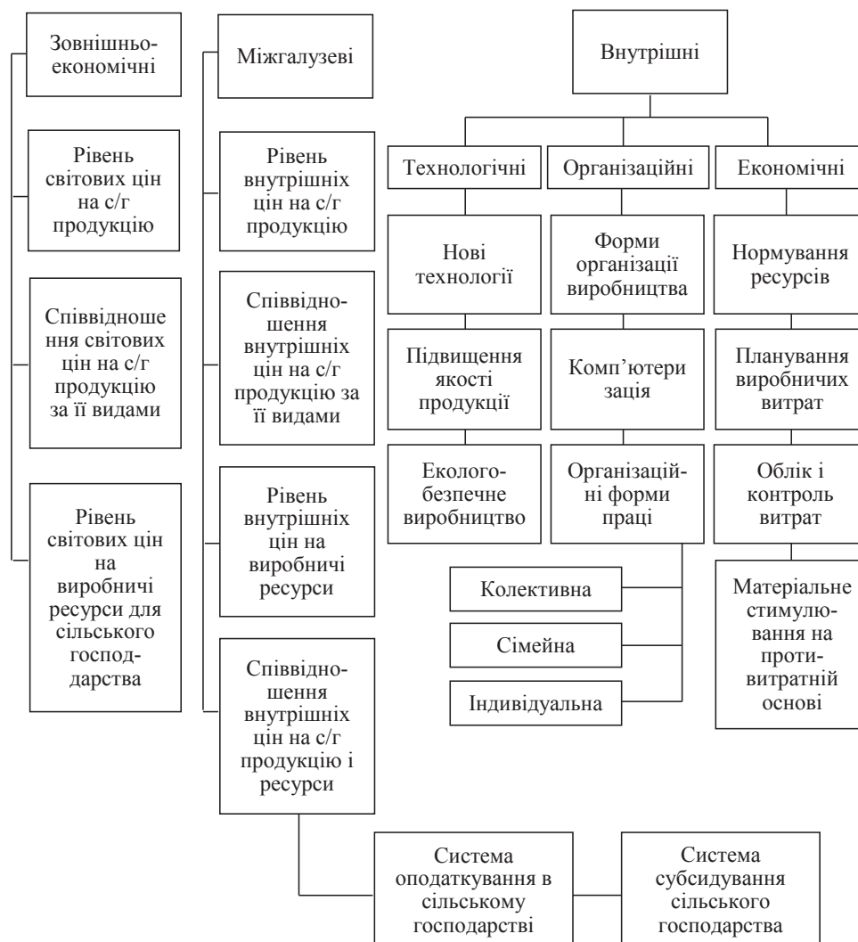
Рис. 2. Чинники формування виробничих витрат у сільському господарстві [2, с. 52]

Висновки. Проведений пошук свідчить, що для ефективного ведення господарської діяльності необхідним є створення системи управ-