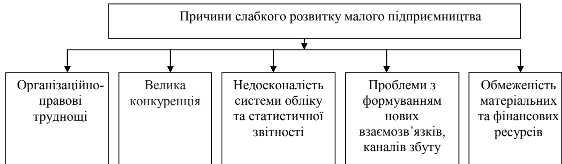
Рис. 4. Причини слабого розвитку підприємства в Україні

кої діяльності, організаційно-правові труднощі, обмеження матеріальних та фінансових ресурсів.