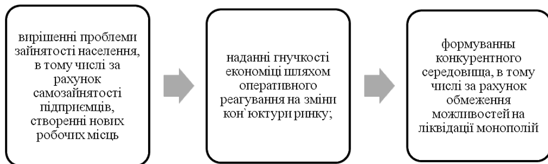
Рис. 1. Принципи функціонування малого підприємництва [3, с. 175]

З табл. 1 видно, що загалом показники мають як негативну, так і позитивну характеристику. Значимість малого підприємництва для України доповнюється динамікою показника кількості малих підприємств. Аналізуючи вищезазначений пункт, ми бачимо, що найбільша кількість малих підприємств спостерігається у 2013 році, а найменша – у 2015 році, тобто впродовж 2012-2015 років динаміка була негативною, отже, можна спостерігати зменшення кількості малих підприємств протягом останніх трьох років. За аналізований період аналогічну тенденцію мають й показники кількості зайнятих працівників, кількості найманих праців-