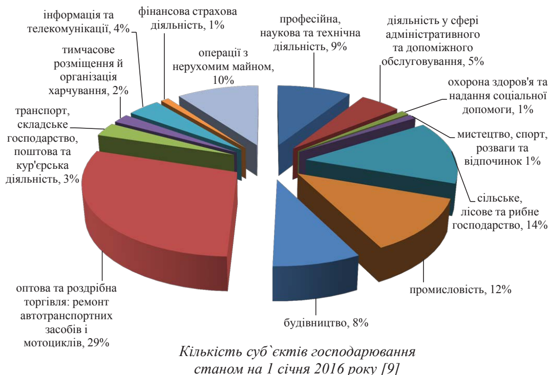
Рис. 3. Класифікація суб'єктів господарювання в Україні за видами діяльності станом на 1 січня 2016 року

Основними причинами слабкого розвитку підприємства в Україні (рис. 4) можна вважати відсутність досвіду здійснення підприємниць-