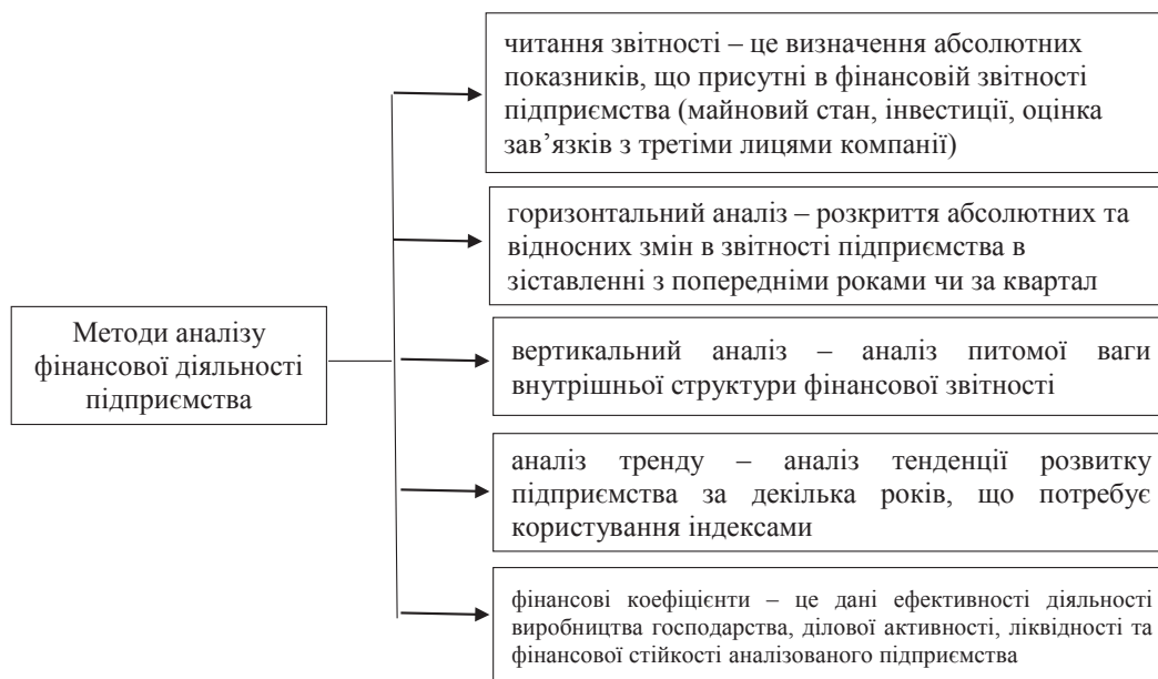
Рис. 3. Методи аналізу фінансової діяльності підприємства

Досить вагомим для будь-якого підприємства є його майновий стан, який виникає в процесі виробничо-господарської діяльності господарства. Він включає в себе аналіз ліквідності, платоспроможності, фінансової стійкості та багато іншого, що допомагає підприємству побачити свої слабкі сторони, загрозу банкрутства та знайти шляхи вирішення цих проблем.