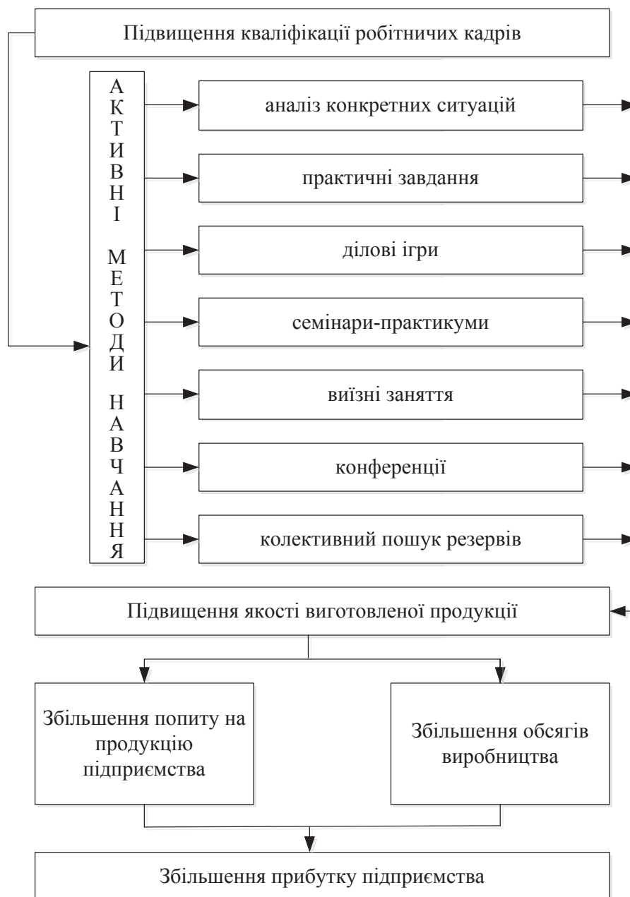
Рис. 2. Вплив рівня кваліфікації персоналу на якість виробленої продукції

Конференції як активний метод навчання використовуються з метою перейняття досвіду передових підприємств. Найчастіше учасниками конференції виступають не всі робітники, а лише ті, які мають наукові розробки з тих чи інших питань або є професіоналами свого діла і мають бажання та можливість передати цей досвід іншим. Крім того, участь в конференціях є аспектом мотиваційної політики підприємства. Мотивація професіоналізму є гарантом стабільності і засадою подальшого професійного зростання [2, с. 131].