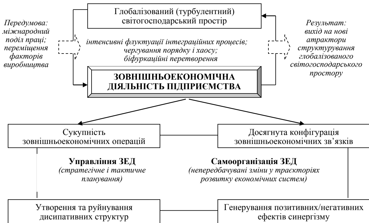
Рис. 1. Зовнішньоекономічна діяльність підприємства як передумова біфуркаційних перетворень глобалізованого світогосподарського простору

Формуючи такий механізм, обов'язково варто зважати на інтенсивність флуктуацій у міжнародному бізнес-середовищі, що зумовлюють ризик відхилення від заданих стратегічних цілей. З позиції А. Свідерської під зовнішньоекономічним ризиком варто розуміти можливість позитивних та негативних відхилень від