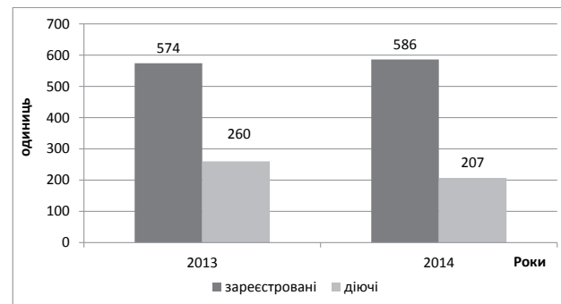
Рис. 3. Кількість зареєстрованих та діючих бірж в Україні [7]

Згідно з даними 2014 р. в Україні діяльність здійснювали 146 бірж, з яких універсальних,