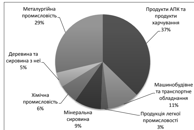
Рис. 1. Структура експорту України за 2015 р. [1]

інші: товари з ТОП-10 найбільш імпортованих Україною є товарами кінцевого чи готового проміжного споживання (рис. 1).