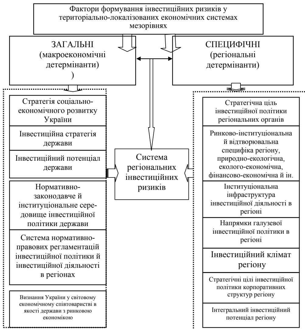
Рис. 1. Укрупнена диференціація факторів формування регіональних інвестиційних ризиків

У рамках такої парадигми представляється очевидною диференціація управлінських стратегій відносно інвестиційних процесів і пов'язаних з ними інвестиційних ризиків у межах окремих територіально-локалізованих економічних систем мезорівня. Іншими словами, при аналізі інвестиційних процесів в економіці країни актуалізується важливість дослі-