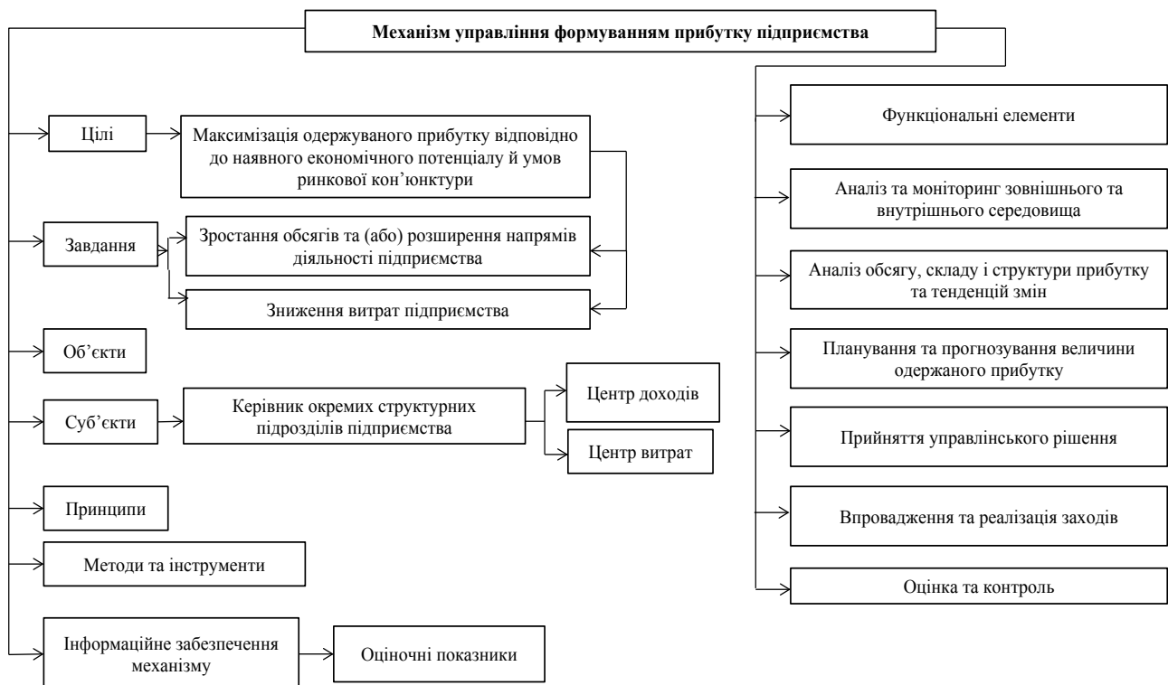
Рис. 2. Організаційно-функціональна структура механізму управління формуванням прибутку підприємства

Для забезпечення чіткості виконання заходів із досягнення окресленої головної мети розробки механізму можуть бути сформульовані підпорядковані їй більш детальні цілі по окремих напрямках діяльності підприємства або ж структурних підрозділів. У цьому контексті поділяємо позицію науковців із приводу того, що визначення цілей має здійснюватися з урахуванням стратегічних пріоритетів роз-