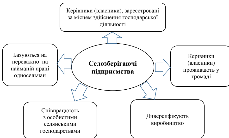
Рис. 2. Критерії віднесення підприємств до селозберігаючого типу