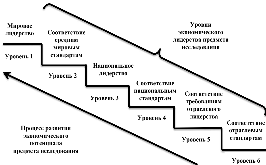
Рис. 1. Развитие экономического потенциала на базе экономического лидерства

Изложение основного материала исследования. Необходимость развития экономического потенциала региона сводится к тому, что совокупная способность экономики региона увеличивается, улучшая качество производственно-экономической деятельности и умножая