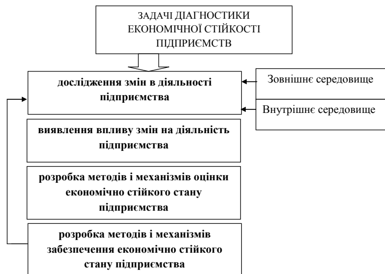
Рис. 2. Задачі діагностики економічної стійкості підприємств