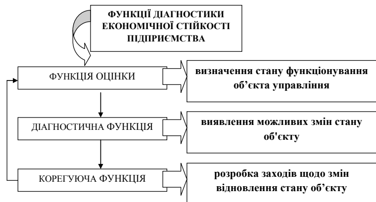
Рис. 1. Функції діагностики економічної стійкості підприємства

підприємства (враховує показник відношення управлінських витрат до темпів підвищення обсягів виробництва продукції, показник економії апарату управління, показник опрацювання інформації); рівень кадрової стійкості підприємства (обчислюється за показником плинності кадрів, показником стабільності персоналу, показником задоволеності потреб працівників, показником підвищення кваліфікації працівників, показником рівня освіти працівників); рівень науково-технічної та інноваційної стійкості підприємства (включає показник рентабельності інновацій, показник рентабельності витрат на науково-дослідні та дослідно-конструкторські роботи); рівень інвестиційної стійкості підприємства (містить показник рентабельності інвестицій, показник інвестиційної активності, показник терміну окупності інвестицій, показник обсягу інвестицій у виробництво); рівень ринкової стійкості підприємства обчислюється за показником рентабельності продажу продукції, показником рентабельності чистих активів, показником товарності, показником рівня маркетингових досліджень).