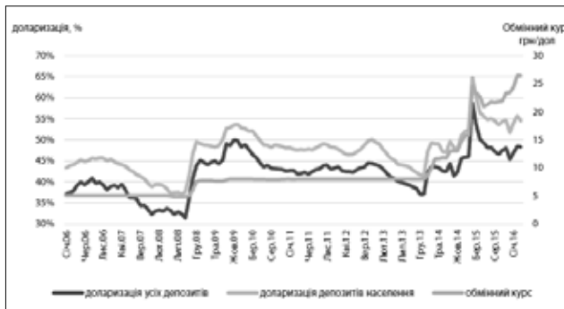
Рис. 3. Динаміка зміни доларизації депозитів протягом січня 2006 – березня 2016 рр., % [7]

В Україні ситуація доларизації депозитів змінювалась протягом останніх десяти років наступним чином (рис. 3).