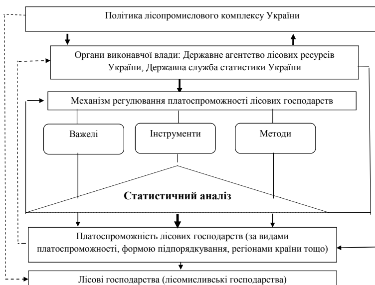
Рис. 1. Місце та роль статистичного аналізу платоспроможності лісових господарств у системі державного регулювання

Так, урахувавши жорсткі умови функціонування ринку, лісові господарства потребують як оперативного, так і стратегічного управління з боку державних органів, яке можливе лише у разі отримання вірогідної та своєчасної інформації. Статистичний аналіз платоспроможності лісових господарств забезпечить необхідною статистичними даними ДАЛРУ та його структурних підрозділів. Розглянемо детальніше місце та роль статистичного аналізу платоспроможності лісових господарств у системі державного регулювання в умовах ринкового середовища (див. рис. 1).