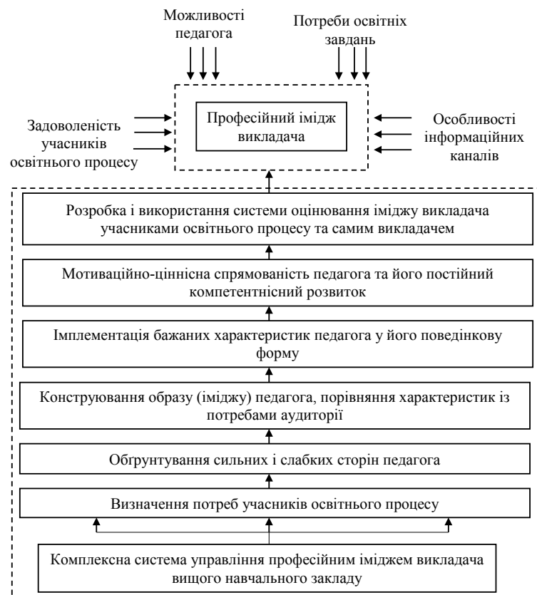
Рис. 3. Комплексна система управління професійним іміджем викладача сучасного вищого навчального закладу