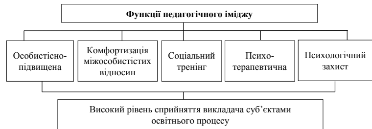
Рис. 1. Функції педагогічного іміджу

– система моральних та етичних цінностей викладача (світосприйняття, ставлення до власної професії та до студентів);