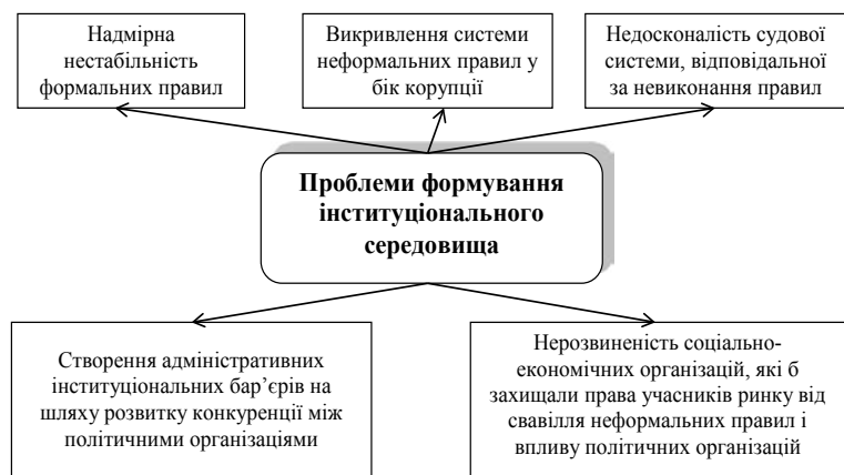
Рис. 1. Основні блоки проблем формування інституціонального середовища в Україні

На думку академіка НАН України О. Алімова, відставання інституціональних змін в Україні від радикальних ринкових реформ призвело до виникнення та поглиблення суперечностей між застарілими принципами формування системи державного управління, що тяжіли до радянських догм, і лібералізацією економічних відносин [3].