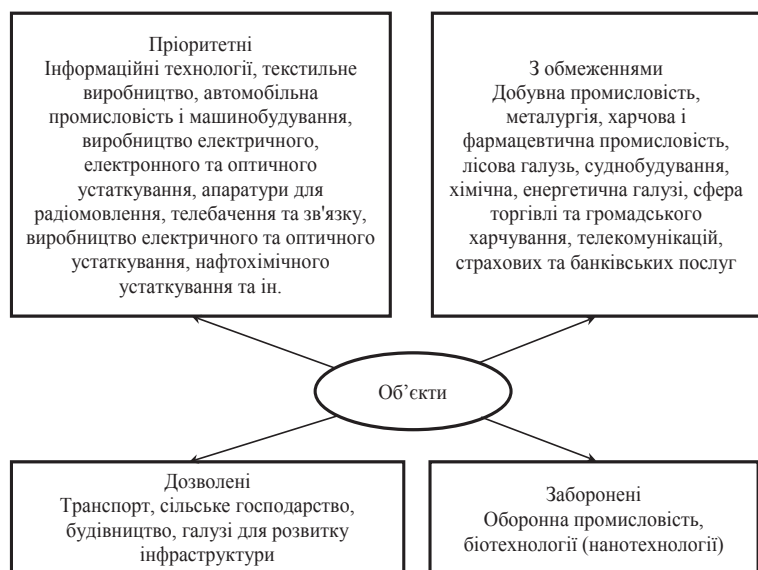
Рис. 2. Пріоритетність об'єктів іноземного інвестування ТНК*

Пріоритетними об'єктами для іноземного інвестування ТНК є виробництво нового обладнання та нових матеріалів, експортної продукції, яка відповідає світовим стандартам, ресурсозберігаючі технології, виробництво машин та устаткування для різних галузей реального сектора економіки. Для інвесторів ТНК щодо