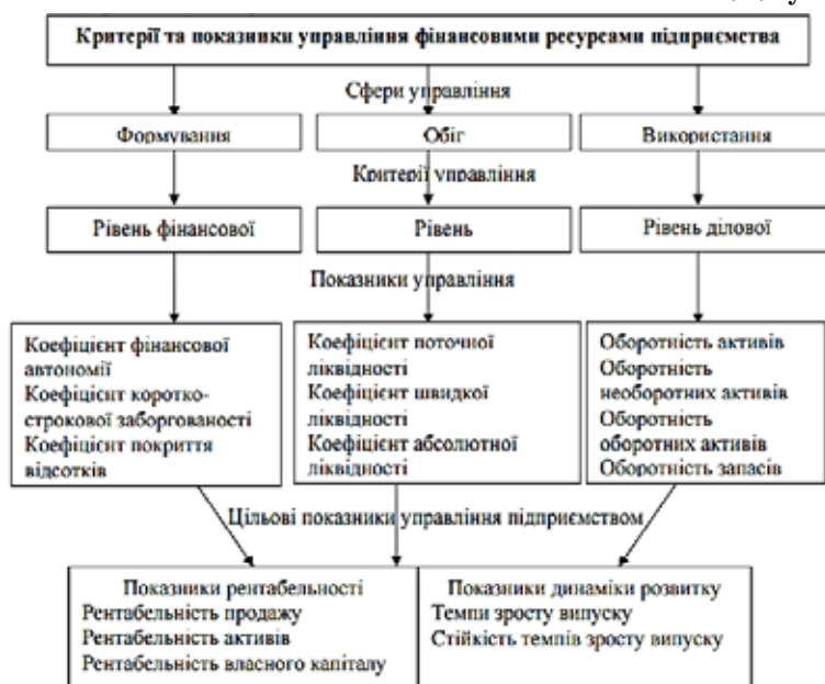
Рис. 3. Критерії та показники управління фінансовими ресурсами підприємства

Проведене дослідження дало підстави запропонувати використання процесного підходу для вдосконалення оцінки ефективності механізму управління фінансовою політикою підприємств харчової промисловості. Виділено основні показники, які використовуються для моделювання бізнес-процесів управління капіталом та визна-