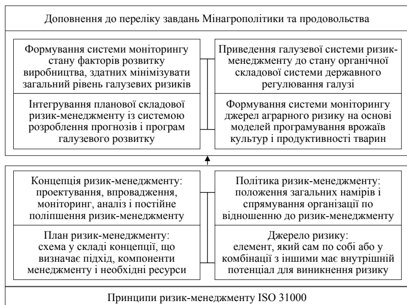
Рис. 3. Схема доповнення переліку завдань Мінагрополітики та продовольства на основі застосування стандарту ISO 31000

Висновки. Успішність функціонування аграрної сфери виробництва є запорукою продовольчої безпеки держави. Велика роль в розвитку аграрного сектора належить підприємству, яке, як і сільське господарство в цілому, є ризиковим. Тому, якщо держава прагне залучити підприємницький потенціал, вона повинна забезпечити йому реалізацію режиму від-