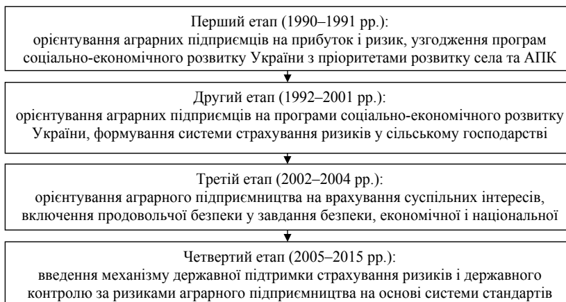
Рис. 2. Етапи зосередження системи державного регулювання на різних антиризикових аспектах аграрного підприємництва

Мінагрополітики та продовольства має забезпечувати виконання антиризикових функцій, таких як контроль за використанням та охороною земель, охороною праці в аграрному секторі економіки, якістю та безпечністю сільськогосподарської продукції та ін. Крім того, даний орган має затверджувати вимоги до введення системи аналізу ризиків і контролю у критичних точках або аналогічних систем забезпечення безпеки при виробництві харчових продуктів, тобто системи, яка визначається ДСТУ ISO 22000 «Система управління безпечністю харчових продуктів». ДСТУ ISO 22000 узгоджений із ДСТУ ISO 9001