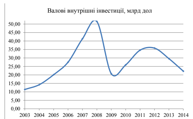
Рис. 2. Валові внутрішні інвестиції, млрд. дол.