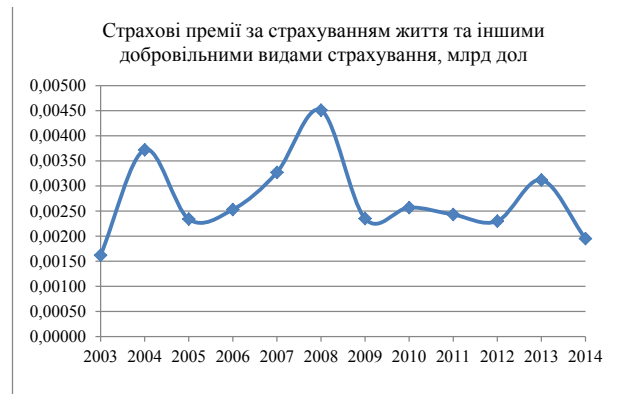
Рис. 1. Страхові премії за страхуванням життя та іншими добровільними видами страхування, млрд. дол.

Для обґрунтування вибору типу математичної моделі слід побудувати кореляційне поле для