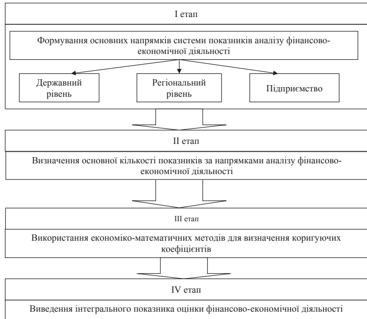
Рис. 2. Основні етапи формування інтегральної оцінки фінансово-економічної діяльності на різних рівнях управління на підставі визначення системи показників

Висновки. Таким чином, сформована система показників оцінки фінансово-економічної