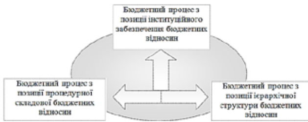
Рис. 1. Інтерпретація організації бюджетного процесу