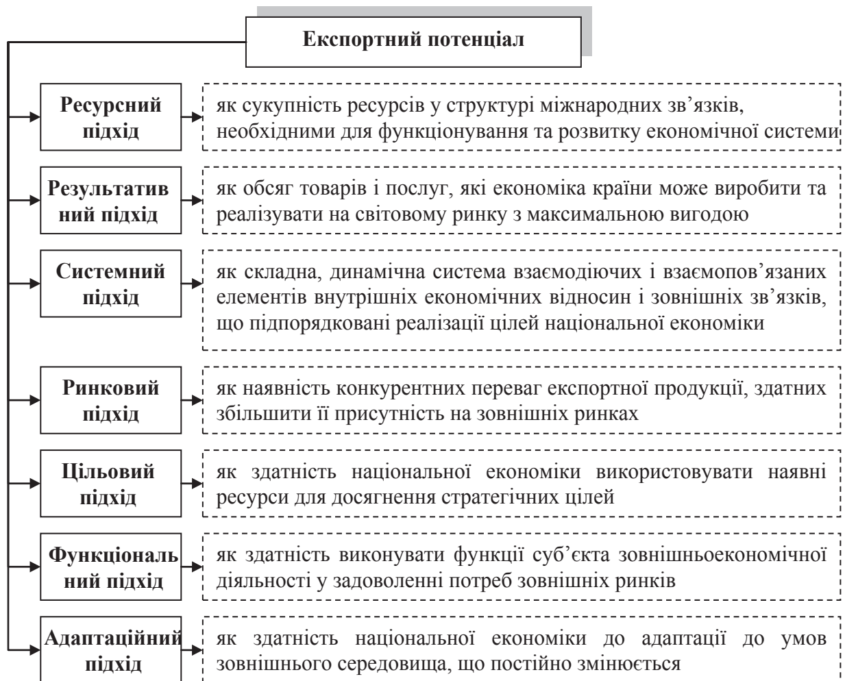
Рис. 1. Характеристика підходів щодо визначення «експортного потенціалу»

– високий рівень тіньової економіки (42% від ВВП) [15];