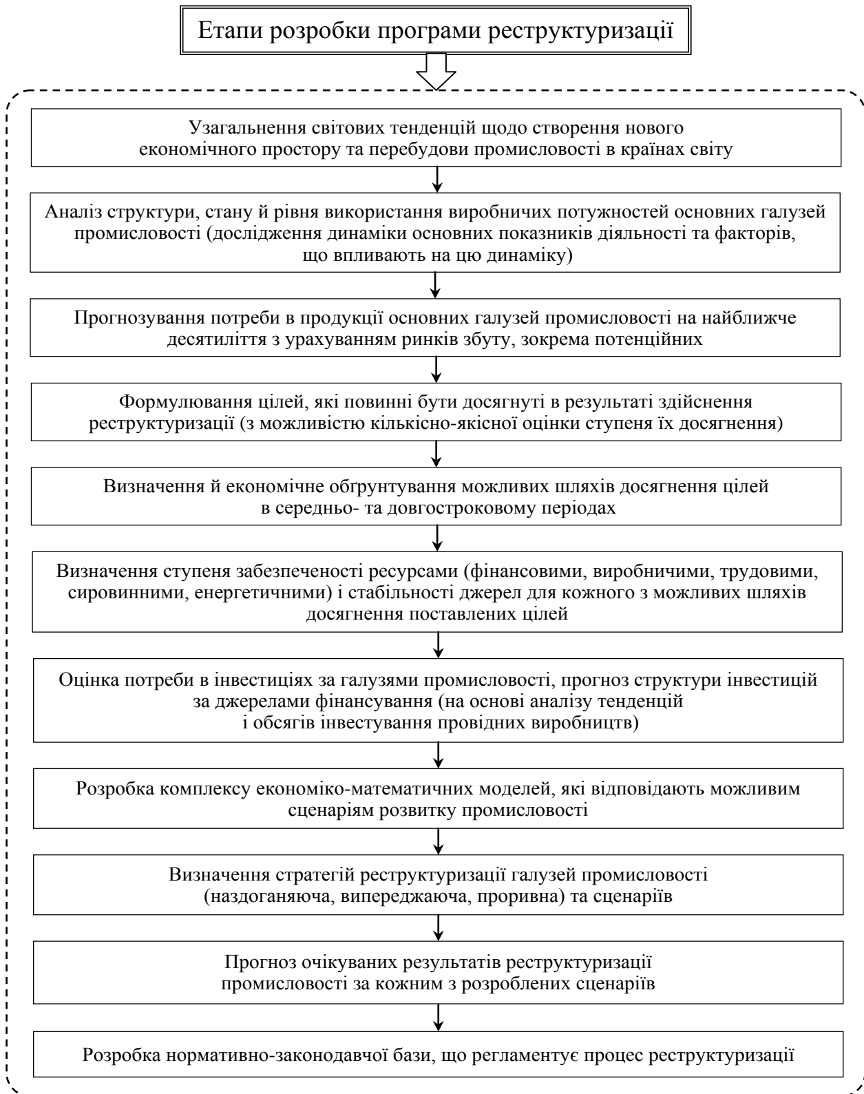
Рис. 4. Етапи розробки програми реструктуризації промисловості

лізувати й доповнити механізм перебудови промисловості з урахуванням стану тих ключових факторів, які характерні для вітчизняної економіки. Тому, крім глобальних загальносвітових тенденцій зміни зовнішнього середовища, необхідно проаналізувати особливості розвитку конкурентних відносин і форм реструктуриза-