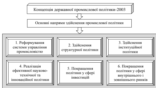
Рис. 3. Основні напрями здійснення промислової політики в Концепції-2003

Загальним для кожної з цих стратегій було визначено досягнення нового технологічного рівня у провідних галузях промисловості, а основними напрямками здійснення визначено наступні (рис. 3).