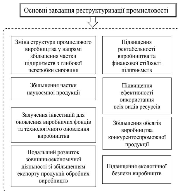
Рис. 5. Основні завдання реструктуризації промисловості

спроб перетворень у вугільній галузі. Тільки в останні кілька років були прийняті державні цільові програми реструктуризації ракетно-космічної та авіаційної промисловостей, суднобудування й деяких інших, але практично здійснені вони не були [13].