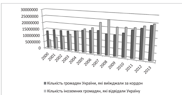
Рис. 2. Динаміка туристичних потоків [6]