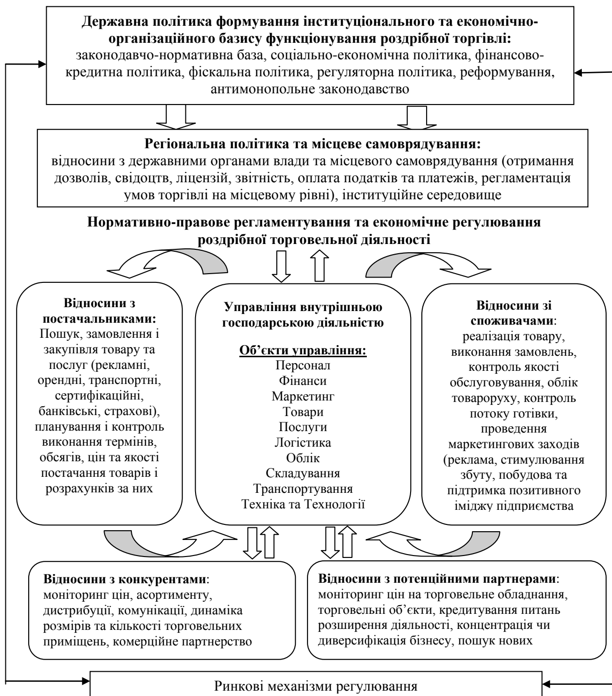
Рис. 2. Об'єкти та взаємозв'язки економічно-інституційного механізму регулювання розвитку роздрібною торгівлі на регіональному рівні

На наш погляд, інституційно-економічний механізм регулювання роздрібною торгівлі є достатньо складною категорією управління і складається з таких елементів: цілі управління; параметри управління як кількісний аналог