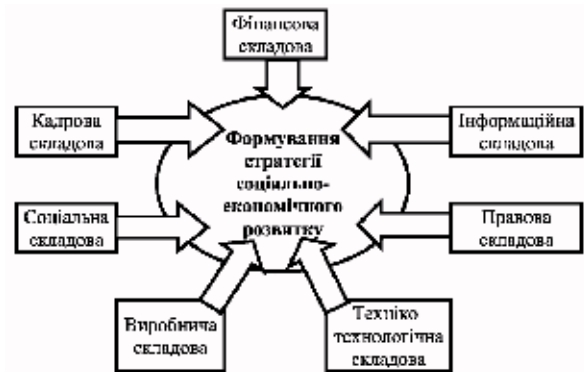
Рис. 1. Модель формування стратегії соціально-економічного розвитку підприємства

Результати дослідження дають можливість зробити висновок про те, що формування стратегії соціально-економічного розвитку пов'язане