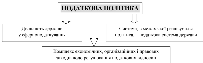
Рис. 2. Підходи до визначення сутності податкової політики держави

Т. Куценко визначає сутність фіскальної політики як процесу маніпулювання державними видатками та доходами з метою впливу на економічний розвиток суспільства [19]. У цьому тлумаченні, на наш погляд, є неточність, оскільки фіскальна політика повинна бути направлена не тільки на економічний розвиток, але і на згладжування циклічних коливань в економіці. Така ж неточність міститься і у визначенні, наведеному у праці М. Азаров, Ф. Ярошенко, Т. Єфіменко, де фіскальна політика розглядається як