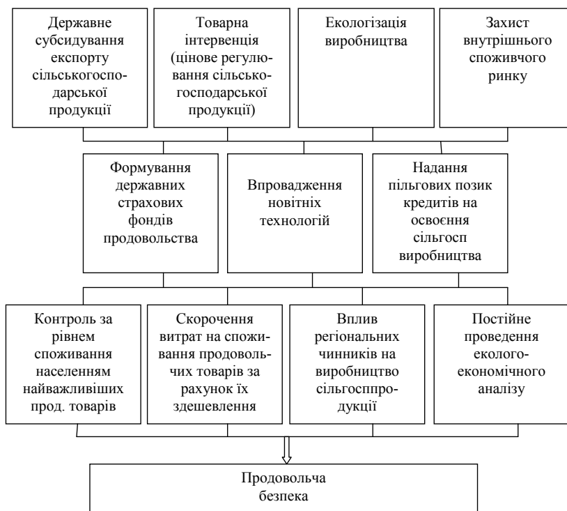
Рис. 3. Основні орієнтири, що забезпечують продовольчу безпеку

Необхідно зазначити, що на ефективність виробництва продуктів харчування для населення важливий вплив справляє кластерний підхід, який активізує перетворення аграрного виробництва на диверсифіковану сферу економіки. До того ж кластерний підхід забезпечує поліпшення не тільки територіальну, а й соціальну специфіку на регіональному і місцевому рівнях, врахування мікроекономічної складової функціонування продовольчого ринку, що є вагомим підставою для формування конкурентоспроможності економіки.