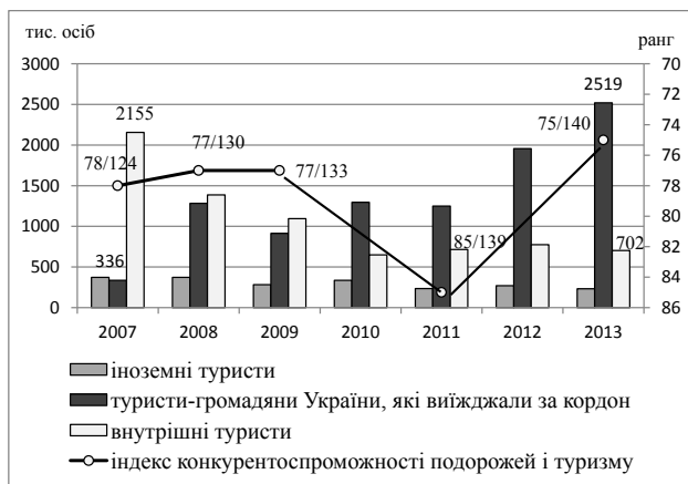
Рис. 2. Динаміка кількості туристів, обслугованих суб'єктами туристичної діяльності України, та індексу конкурентоспроможності подорожей і туризму