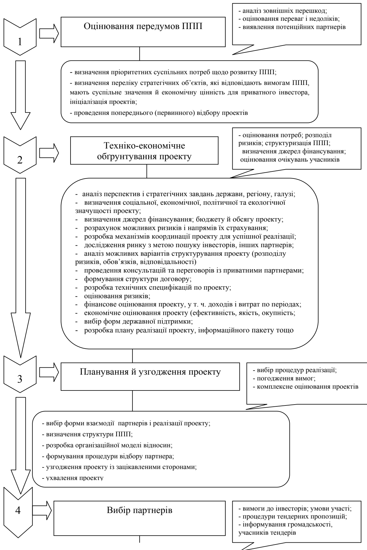
Рис. 1. Методологія формування та розвитку ППП у туризмі на засадах структурно-системного й функціонального підходів