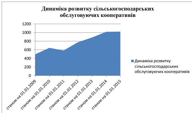
Рис. 2. Динаміка розвитку сільськогосподарських обслуговуючих кооперативів [3]

З подано інформацію про обсяг реалізованої продукції через сільськогосподарські обслуговуючі кооперативи продукції та виробленої їхніми учасниками продукції, а також сфери збуту.