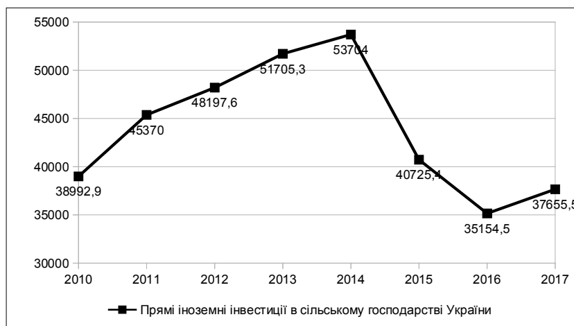
Рис. 2. Динаміка надходження прямих іноземних інвестицій у сільське господарство України, 2010–2017 рр., млн. грн. [7]