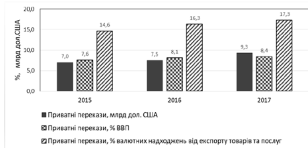
Рис. 1. Приватні грошові перекази мігрантів у млрд. дол. США, а також у % від ВВП і валютних надходжень від експорту товарів та послуг за період 2015–2017 рр.

Однак для працівників-мігрантів із третіх країн у Європейському Союзі все ще бракує рівних умов для найму та збереження роботи. І хоча мігранти з регулярним статусом частіше отримують роботу, навіть вони не завжди мають гідні та безпечні умови праці порівняно з громадянами ЄС.