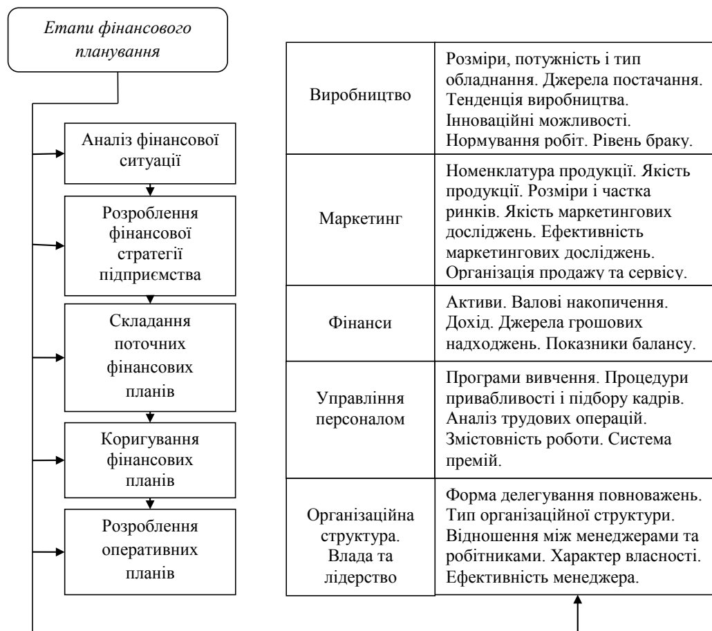
Рис. 2. Процес фінансового планування та його вплив на фінансово-господарську діяльність підприємства [18; 19; 22]