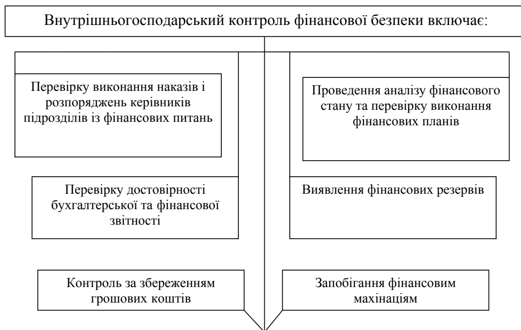
Рис. 1. Здійснення внутрішньогосподарської фінансової безпеки підприємства

Внутрішньогосподарський контроль є основним джерелом забезпечення управління фінансовою безпекою підприємства, яка розробляється власником та спрямована на забезпечення дотримання законності й економічної доцільності здійснення операцій; збереження