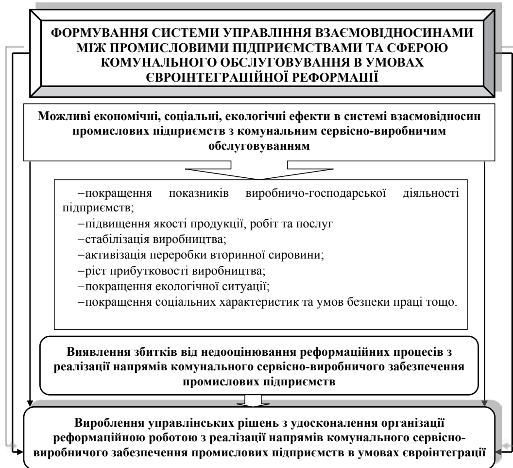
Рис. 5. Система управління взаємовідносинами між промисловими підприємствами та сферою комунального обслуговування в умовах євроінтеграційної реформації