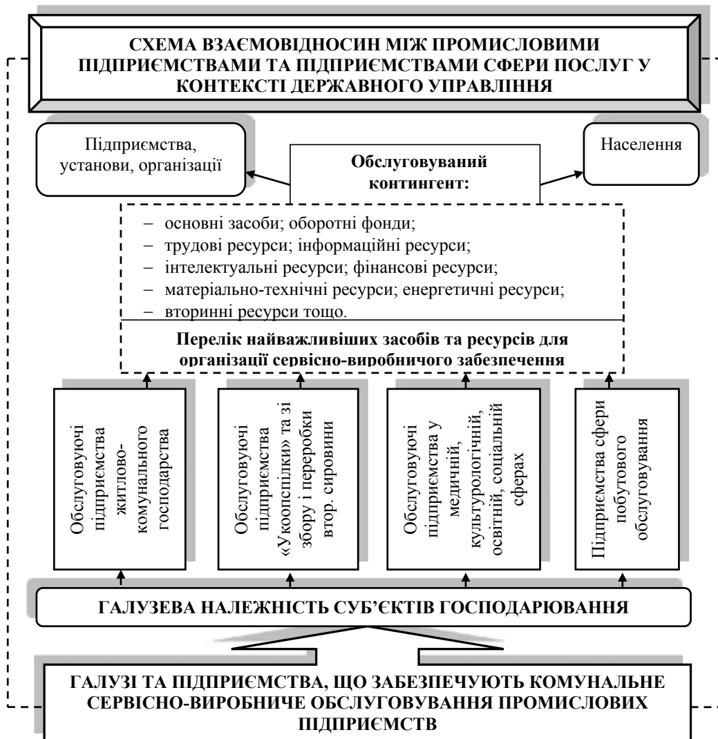
Рис. 1. Класифікація обслуговуючих підприємств за галузевим принципом та обслуговуванним контингентом

При цьому важливо зауважити, що основу стратегічного напрямку становить стратегічне планування, яке охоплює широкий спектр