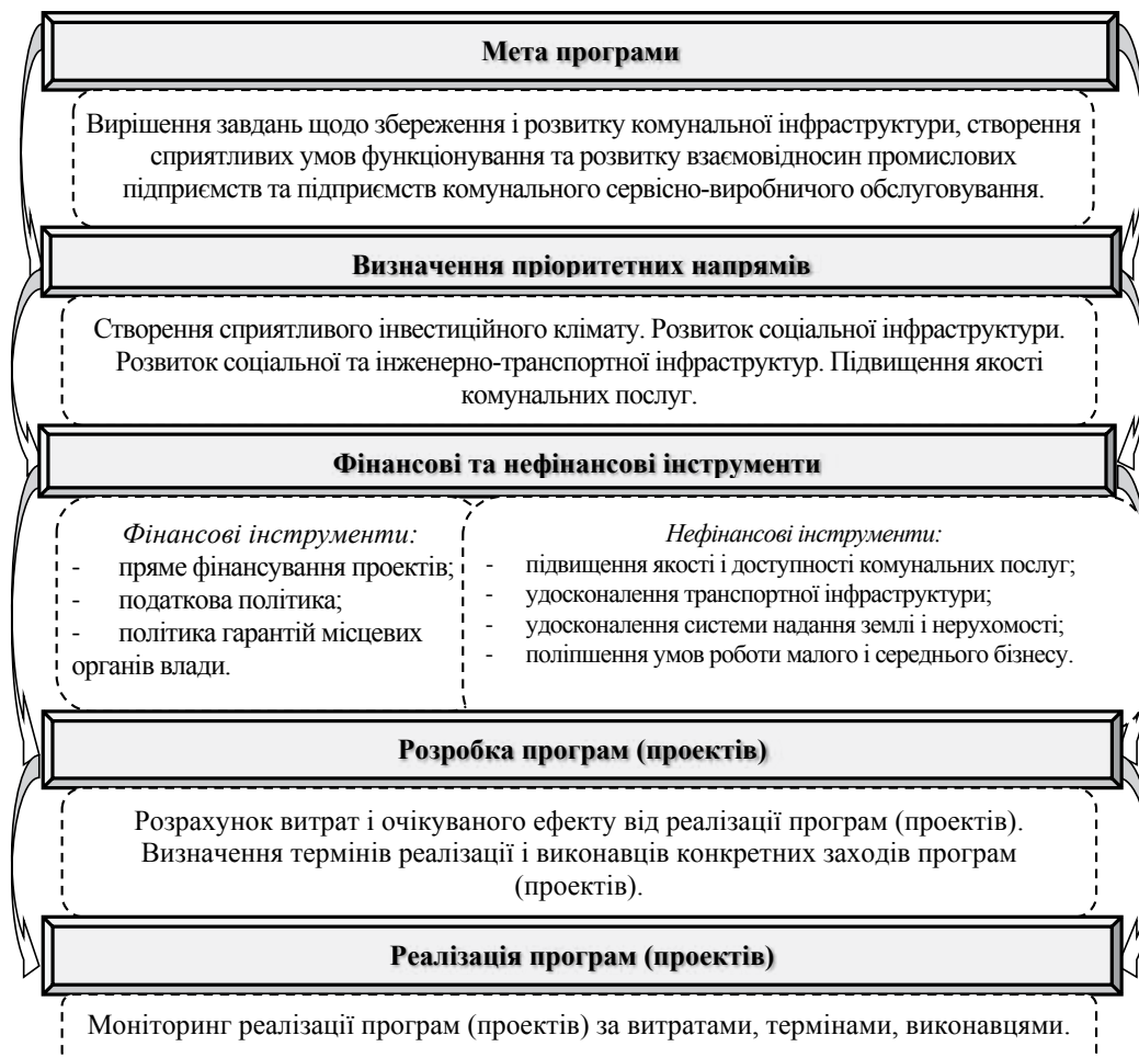
Рис. 2. Процес формування і реалізації програми розвитку комунального сервісно-виробничого обслуговування в умовах промислових підприємств

Можливим шляхом відновлення та розвитку фінансування інвестиційної діяльності підприємств в умовах комунального забезпечення є співпраця держави та бізнесу в формах державно-приватного партнерства з метою демонополізації ринку комунальних послуг [3].