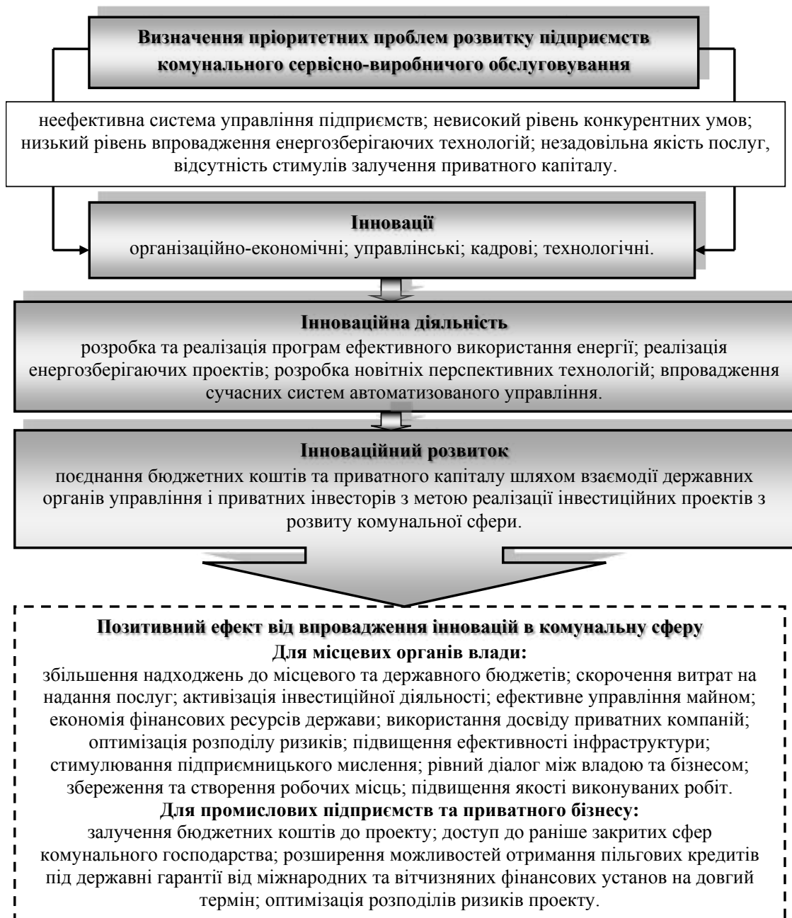
Рис. 3. Інноваційні підходи до вдосконалення інфраструктури комунального сектору економіки, під компетенції якого підпадають промислові підприємства

лізації в умовах комунального сервісно-виробничого забезпечення повинні здійснюватись на основі визначення передумов, чинників та принципів організації взаємовідносин (рис. 4).