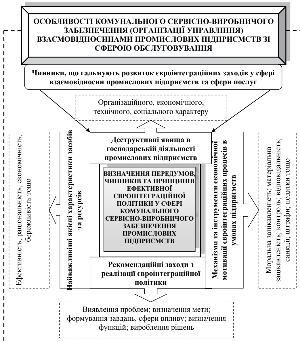
Рис. 4. Визначення передумов, чинників та принципів ефективною євроінтеграційної політики у сфері комунального сервісно-виробничого забезпечення промислових підприємств

ційно-економічний механізм, який мало в чому змінився порівняно з часами адміністративно-командної системи. Йому і досі властиві орієнтація переважно на державну форму власності, наскрізна вертикальна адміністративна підлеглисть, прив'язка до планових завдань системи оцінки, незацікавленість персоналу у підвищенні якості своєї роботи, централізоване встановлення цін на комунальні послуги.