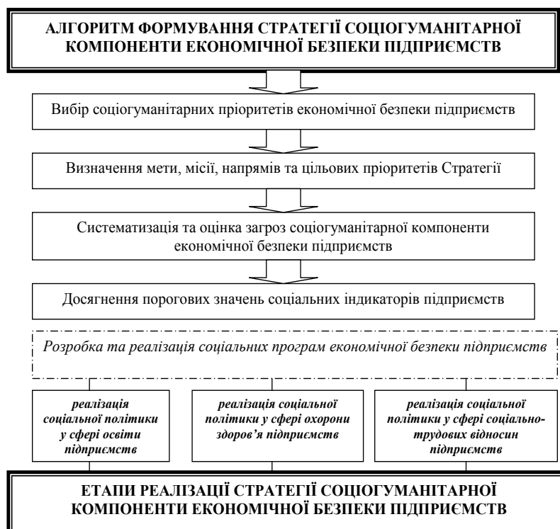
Рис. 2. Етапи формування та реалізації стратегії соціогуманітарної компоненти економічної безпеки підприємств

Акумулюючи вищеописане, зазначимо, що пріоритетними напрямками соціогуманітарної та економічної політики в системі економічної безпеки підприємств, спрямованої на сталі підвищення рівня доходів та якості життя