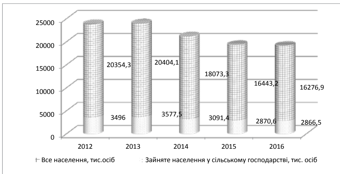
Рис. 2. Динаміка кількості зайнятого населення в сільському господарстві (тис. осіб), 2012–2016 рр.

– нарощування обсягів виробництва конкурентоспроможної продукції, диверсифікація виробництва, що забезпечать відтворення робочих місць, адже виникне потреба у збільшенні числа працівників відповідних професій;